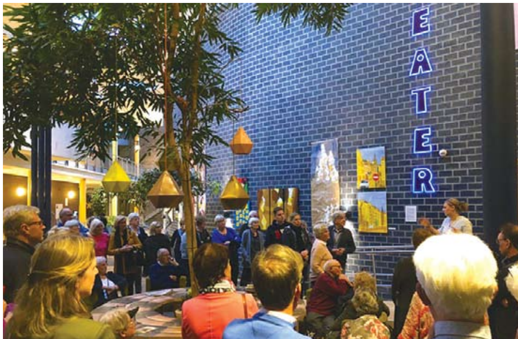
Museum- en theaterbezoek.