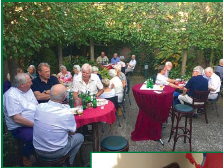
Bijeenkomst in de binnentuin.