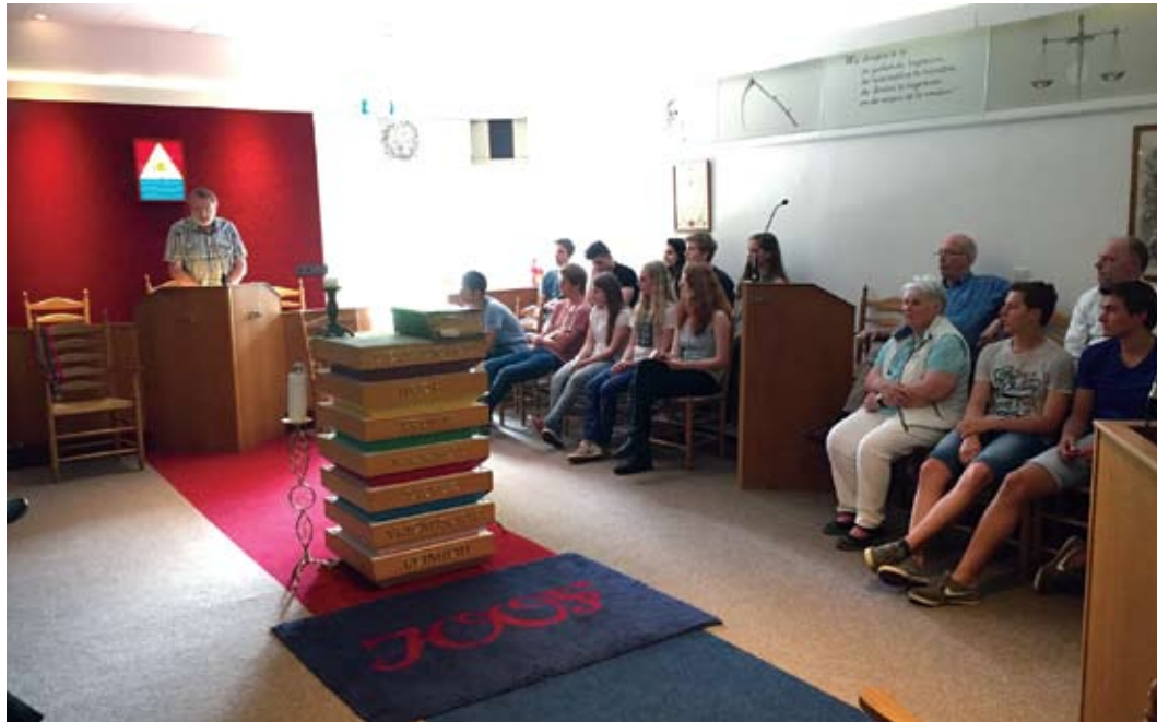
Informatie aan leerlingen van 4 en 5 VWO.