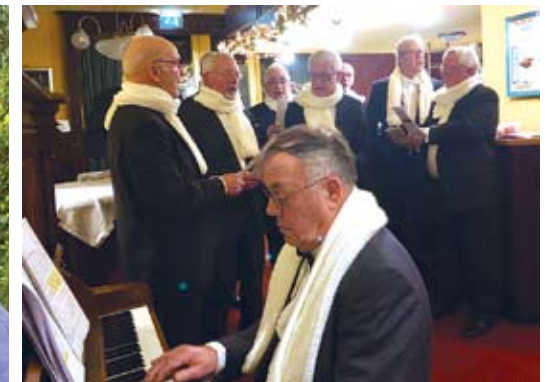
Het Odd Fellow mannenkoor.