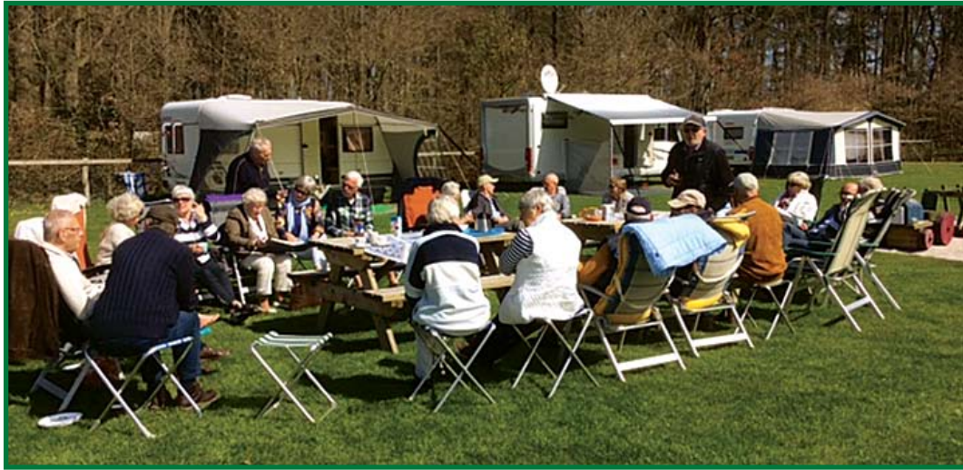
Gezamenlijk een weekend weg.