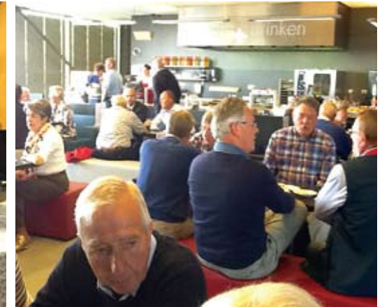
Lezing en bezoek aan de 2e Maasvlakte.