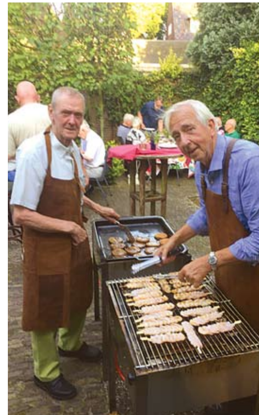
De jaarlijkse barbeque.