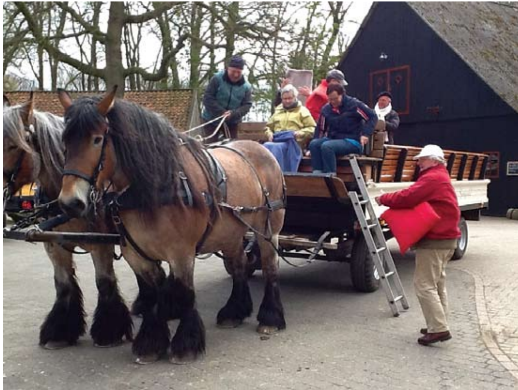
Cultuur snuiven in Springendaal.