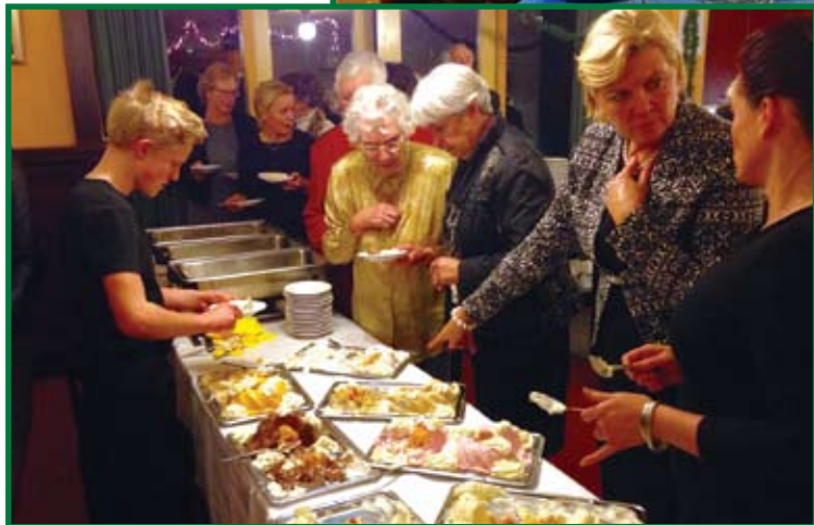
Vorbereiding voor een bijeenkomst met een groep van 'De Zonnebloem'.