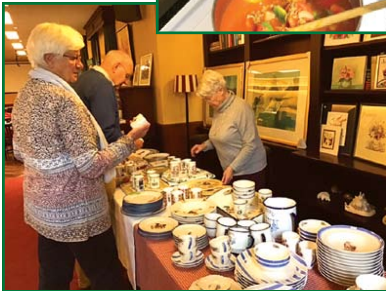
Verkoop-fair in het Odd Fellowhuis.

De logeleden zijn een divers gezelschap, zowel in leeftijd, ervaring, achtergrond als in levensvisie. Het samenzijn is wat hen bindt.