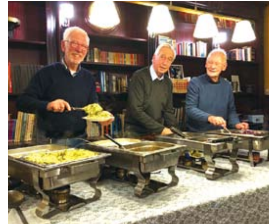
De mannen aan het werk.

Iedereen die zich daardoor aangesproken voelt, kan lid worden van de Verdraagzaamheidsloge.