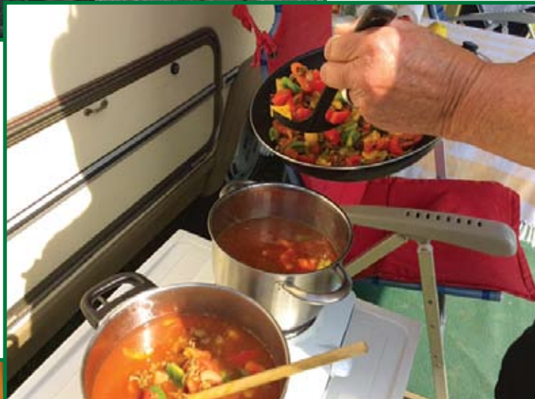
Voor de inwendige mens.