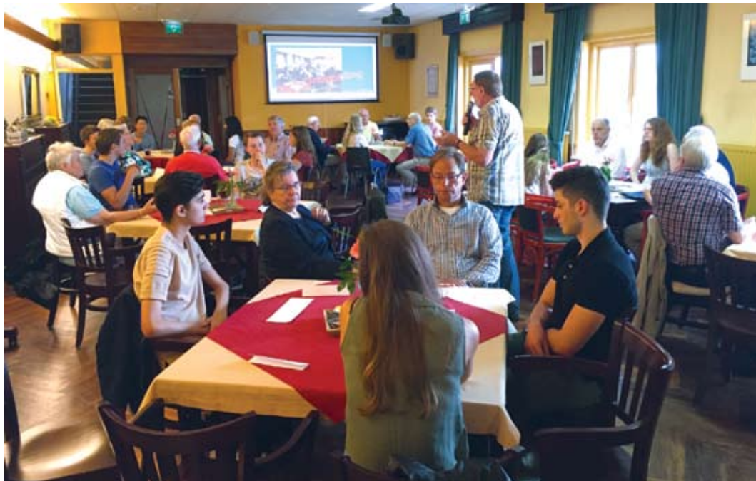
De loge in gesprek met scholieren.

De eerste zitting in het logegebouw is feestelijk en ook indrukwekkend. Deze eerste bijeenkomst wordt geleid door Voorzittend Meester broeder Ribbels. Er zijn dan 21 broeders aanwezig en vele gasten van verschillende loges, district- en Grootloge-bestuur alsook de Rebekkah's van verschillende vrouwenloges.