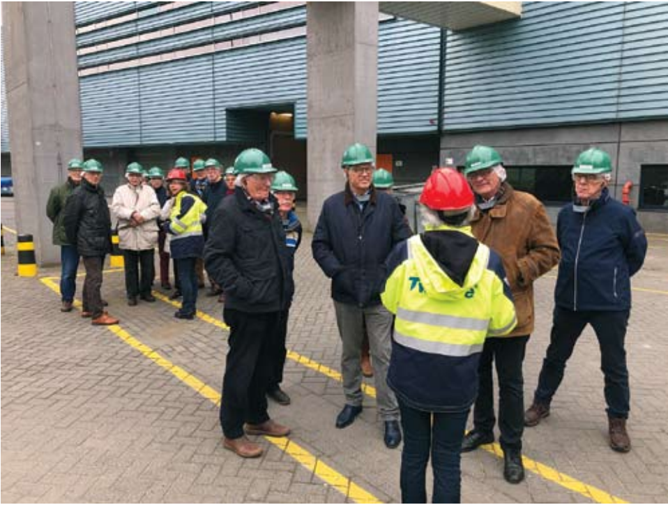
De loge op bezoek bij Twence afvanverwerkingsbedrijf.