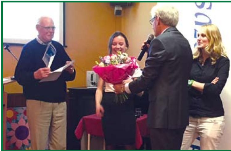
Uitreiking van de prijs aan de winnares van de essay-wedstrijd