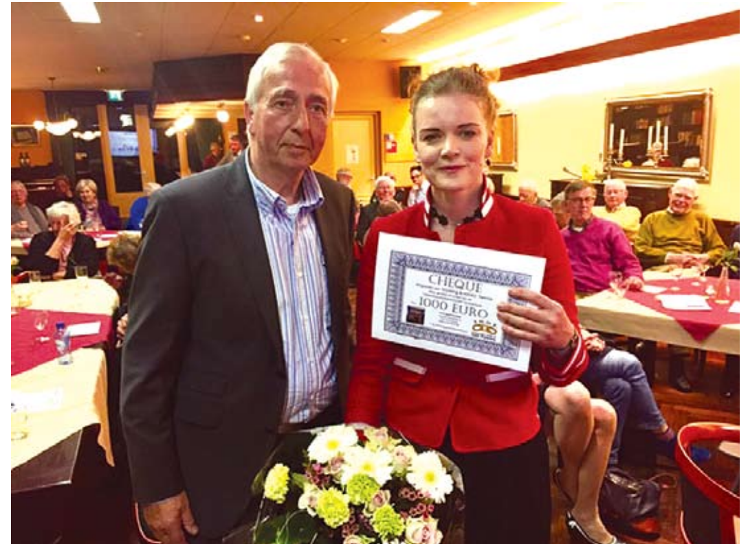
De loge doet Stichting Buddiez een schenking.

bungalowpark georganiseerd voor gezinnen met jonge kinderen, die zich dit al vele jaren niet konden veroorloven.