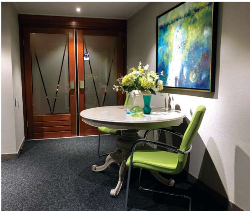
De sfeervolle entree van het logegebouw.