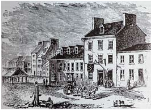
Herberg 'De Zeven Sterren' in Baltimore waar op 26 april 1819 de Washington Loge no. 1 werd gesticht.