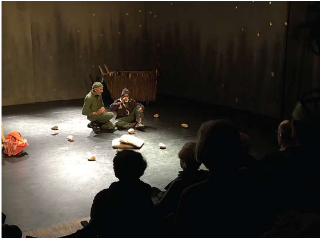
Theatervoorstelling over armoede en bijstand.