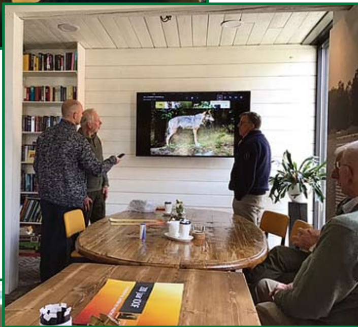
Lezing over "de wolf in Nederland".