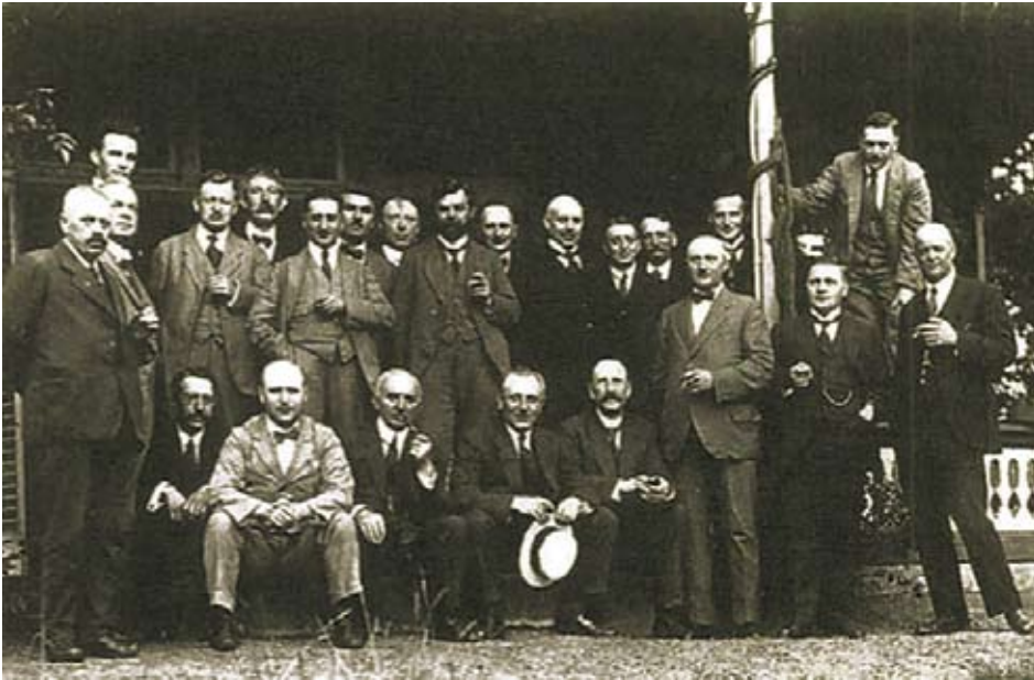
De leden van de verdraagzaamheid loge in 1925.

Toen het ledental steeg naar 14 werd, een verblijfplaats gevonden in hotel Mulder aan de Haaksbergerstraat 11 en later in hotel Rijbroek aan de Zuiderhagen 43. Het ledenaantal steeg vervolgens gestaag tot 35. Enschede telde in die tijd 43.000 inwoners.