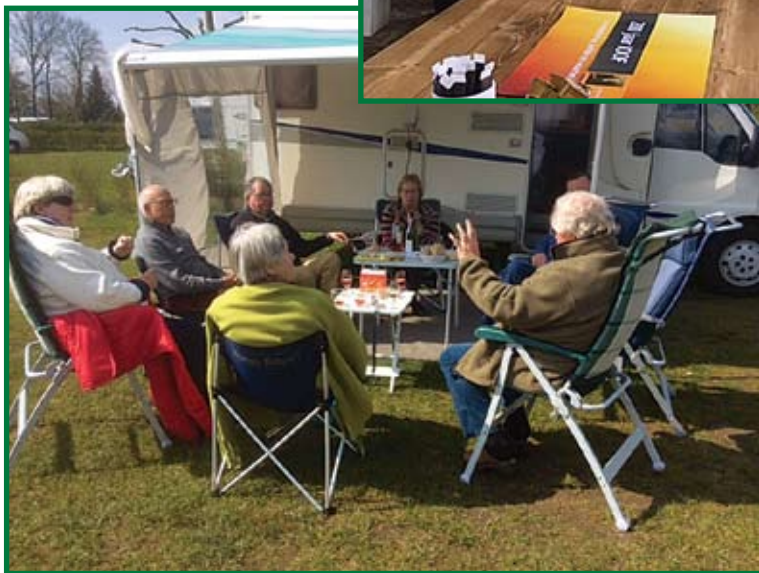
Overleg tijdens een kampeerweekend.