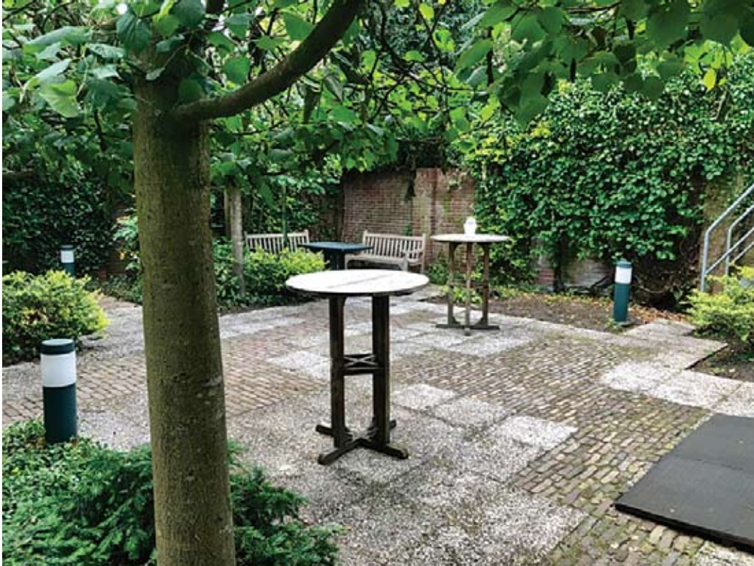
De tuin van ons logegebouw.

Dit boek is samengesteld ter ere van het 100-jarig jubileum van de Verdraagzaamheidloge No. 39.